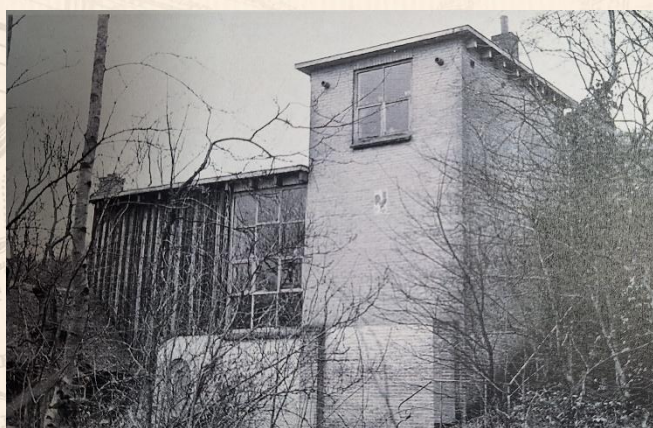
Huis van Chris van Geel aan de Achterweg in Groet

Deze lezing wordt in samenwerking georganiseerd door cultuur-historische vereniging Scoronlo en de Bibliotheek Kennemerwaard, vestiging Schoorl.