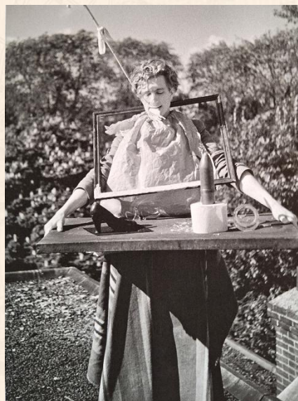
Dienblad